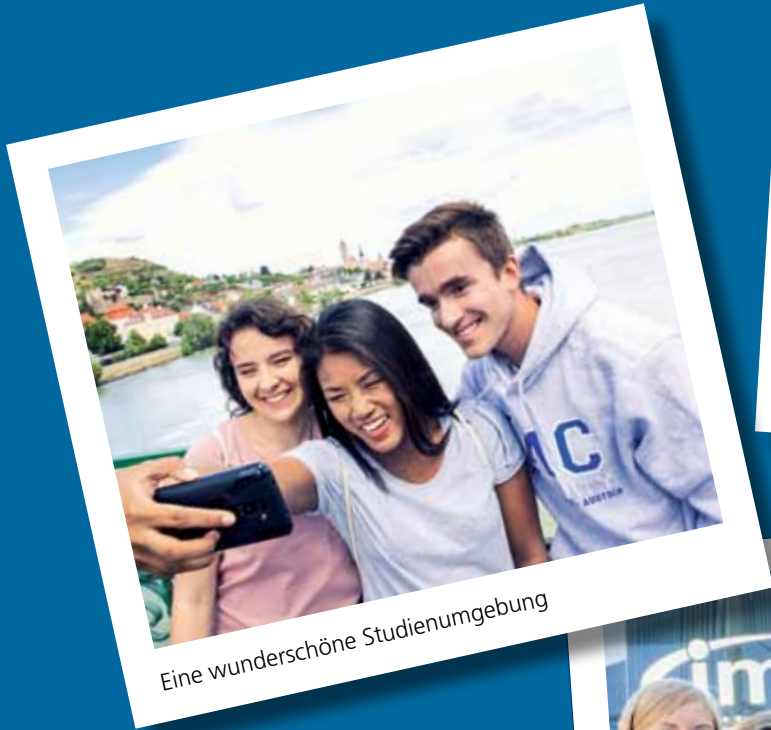
Eine wunderschöne Studienumgebung