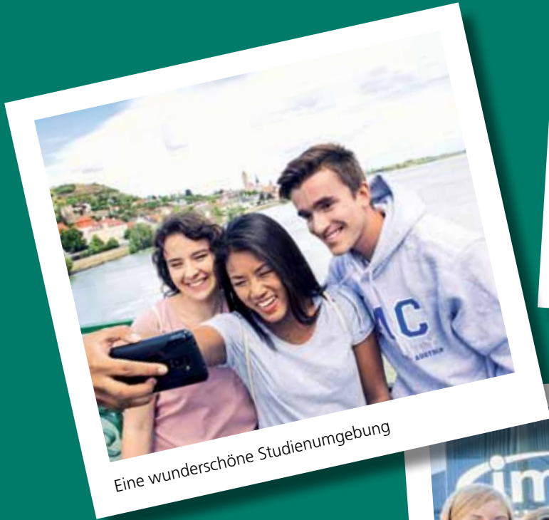
Eine wunderschöne Studienumgebung